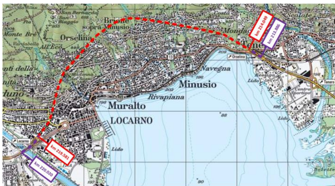
Area interessata dal progetto

Il comparto interessato dal progetto è la tratta stradale dal km 213.886 al km 220.020 prendendo in considerazione le zone di approccio alla galleria.